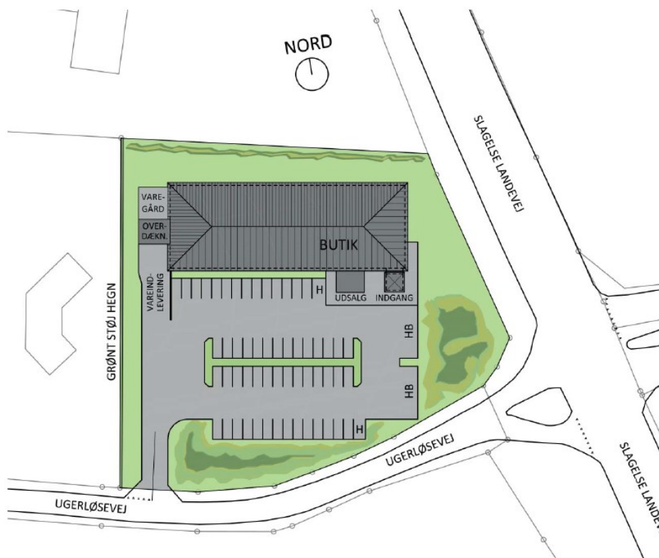
Skitsetegning af butik med tilhørende parkeringsplads.

Projektudvikler vurderer derfor, at der er et tilstrækkeligt lokalt opland til butikken.