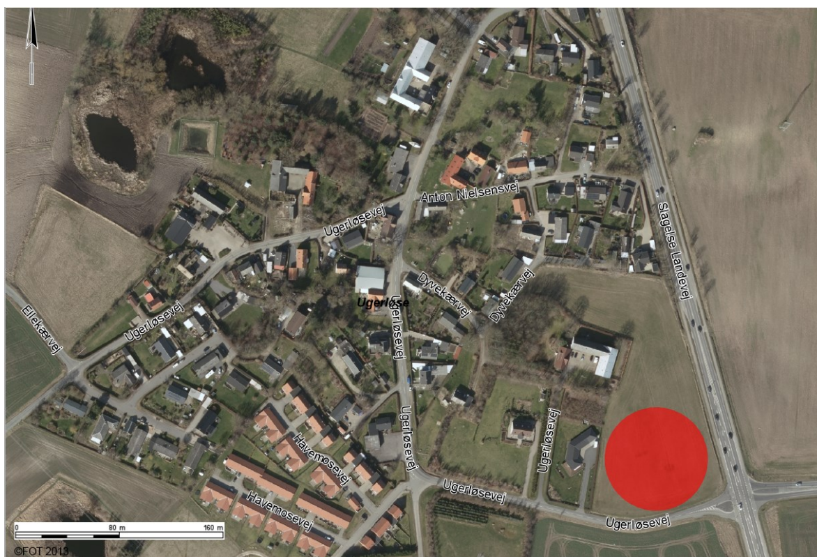
Luffoto over Ugerløse, der viser det omtrentlige projektområde (rød cirkel).